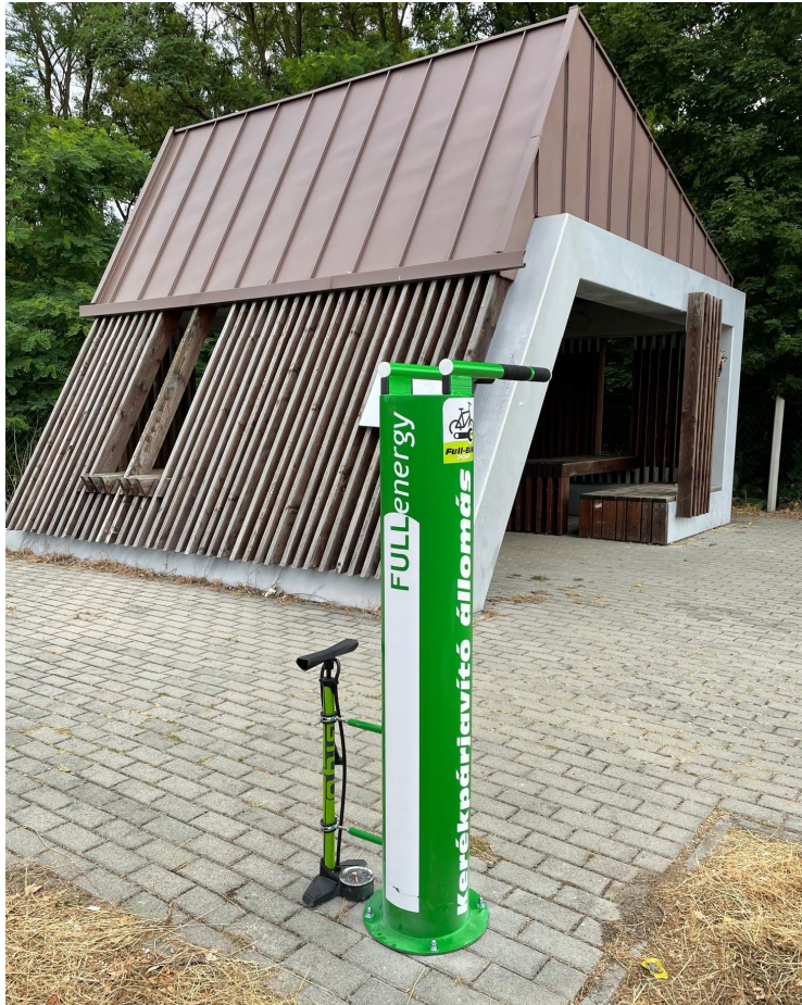
1. kép: FullBike pont a kerékpáros pihenőnél

Első körben még 2020-ban a kapuvári töltőállomásukra telepítettek egy állomást, 2021-ben pedig elhelyezték a következőket a Fő téren a Shop-Stop Pizzeria & Café elé, valamint a Damjanich utca és az Öntésmajorba vezető közút kereszteződésében lévő kerékpáros pihenőnél.