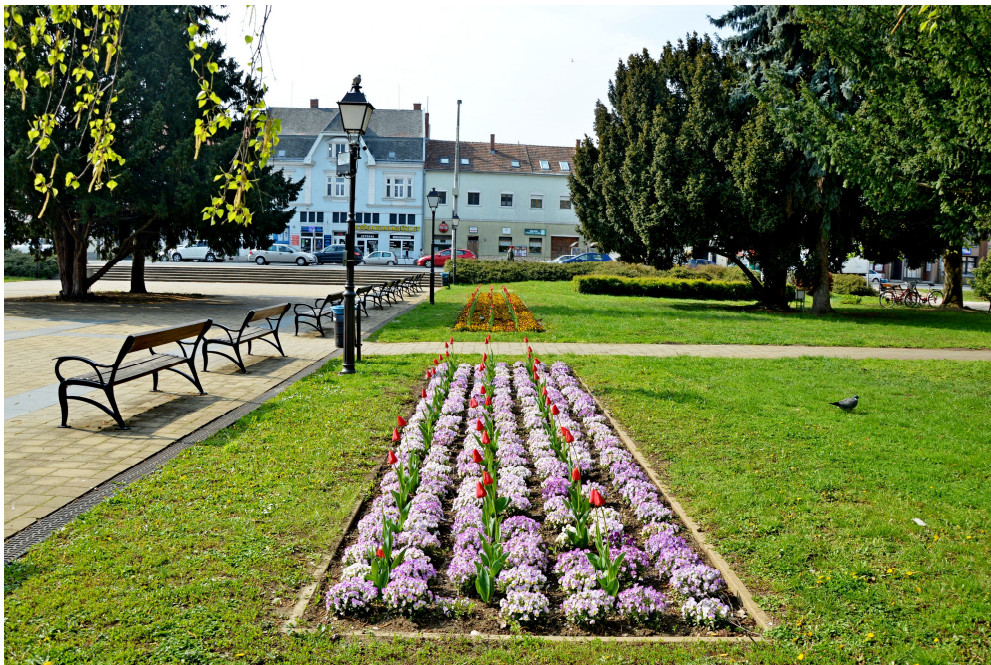
Hősök Parkja 2019

Az igényesen kialakított virágágyások a város központjában szemet gyönyörködtető látványt nyújtanak minden évben: